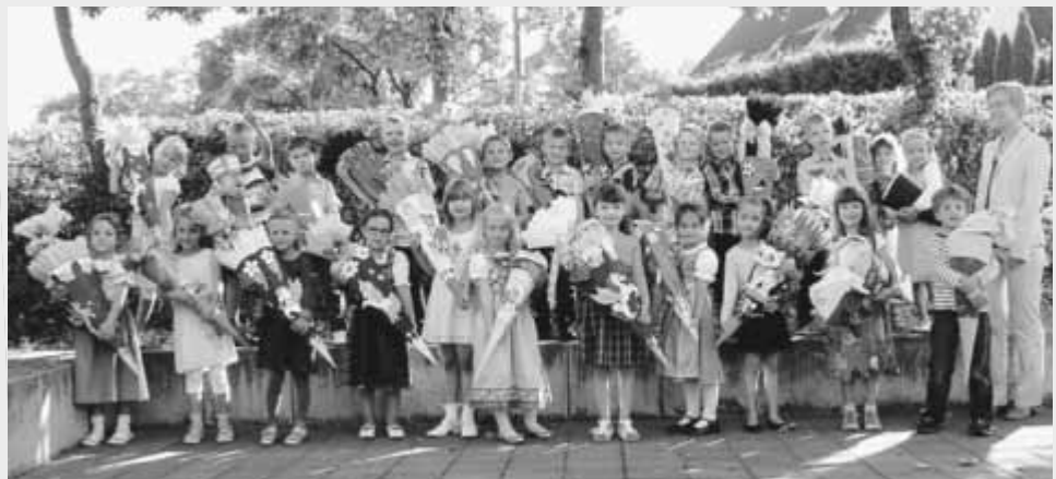
Erste Klasse Schuljahr 2016/17

Wir wünschen einen angenehmen Start ins neue Schuljahr und viel Erfolg!